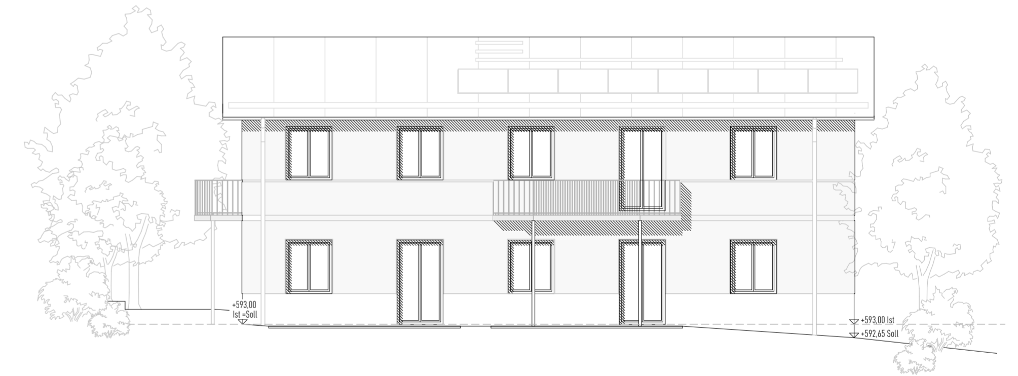
Ansicht Süd Haus 1

Unterschrift Vertreter der Bauherrn (Frei & Essler Baumanagement GmbH)